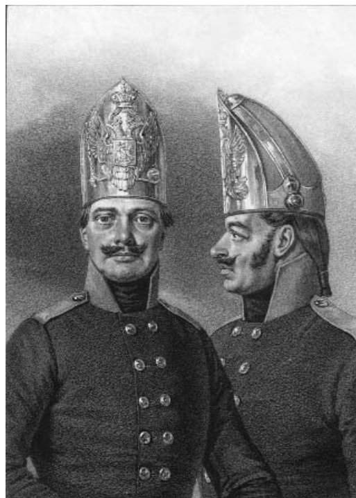
Фузилерные шапки Днестровской Инспекции Херсонского Гренадерского полка. 1802–1804 гг.

В популярной литературе по истории русского военного мундира существует мнение, что ответственность за онемечивание русского мундира лежит