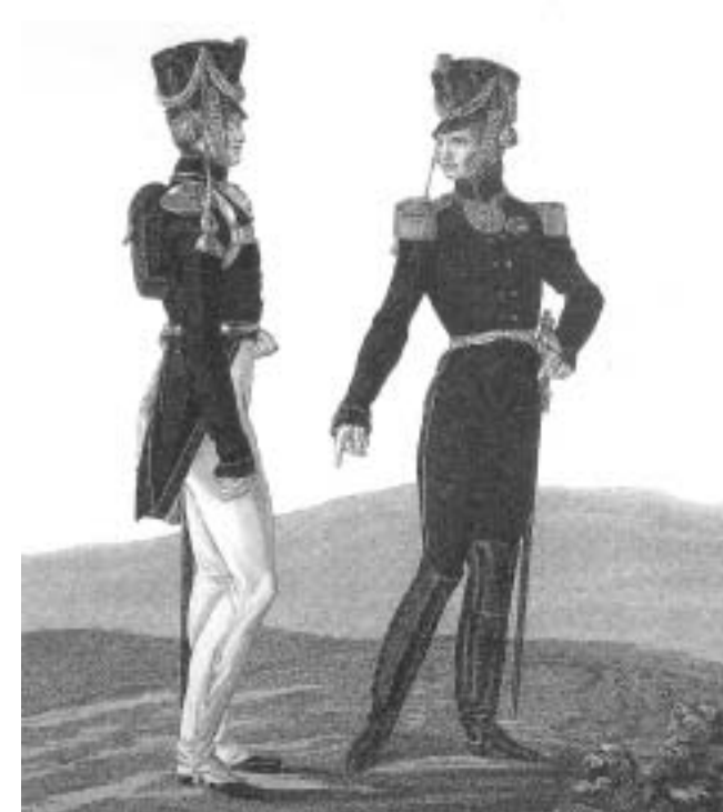
Обер-офицер и штаб-офицер егерских полков. 1816 г.

Из указа «В облегчении войск Государь Император высочайше повелеть изволил нижним чинам обрезать косы под гребёнку». То есть из кос был вынут стерженёк, и косы были срезаны, а офицерам и генералам, как кто захочет.