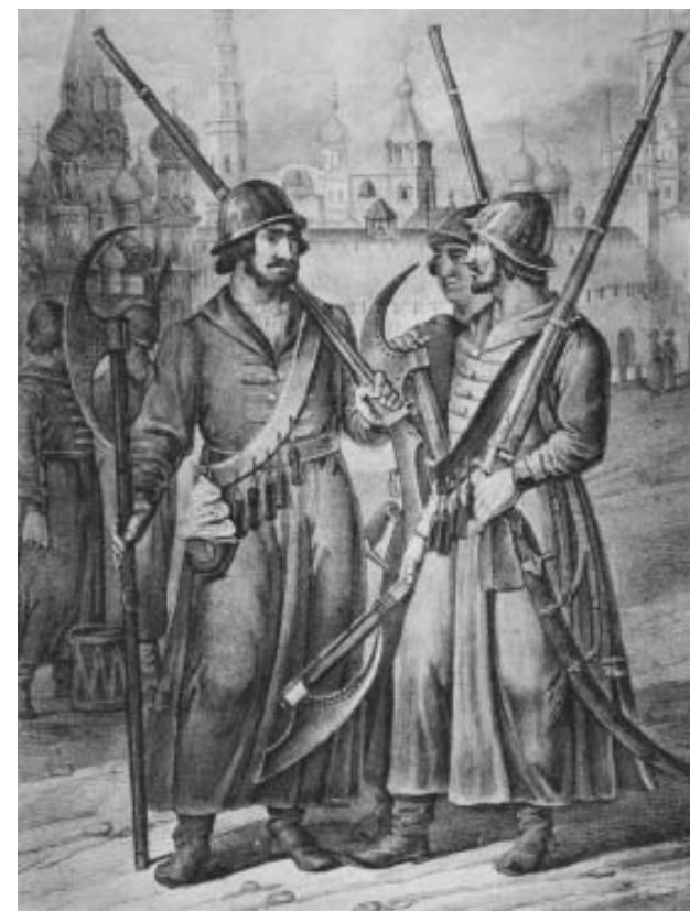
Одежда и вооружение стрельцов XVI–XVII вв.

В те времена приходилось воевать сначала числом, а потом – умением. Сражения XVIII и начала XIX веков – это сражения линий. Линии стрелков постепенно сближались друг с другом, вели огонь из стрелкового оружия,