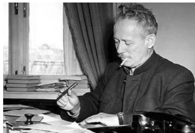
М.А. Шолохов (1905-1984)