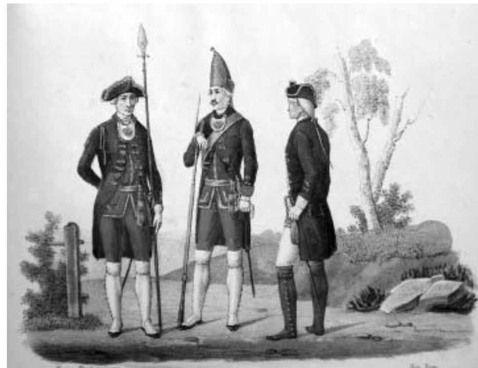
Офицеры Преображенского полка, Семёновского полка и Лейб-гвардии Бомбардирского батальона. Середина XVIII в.