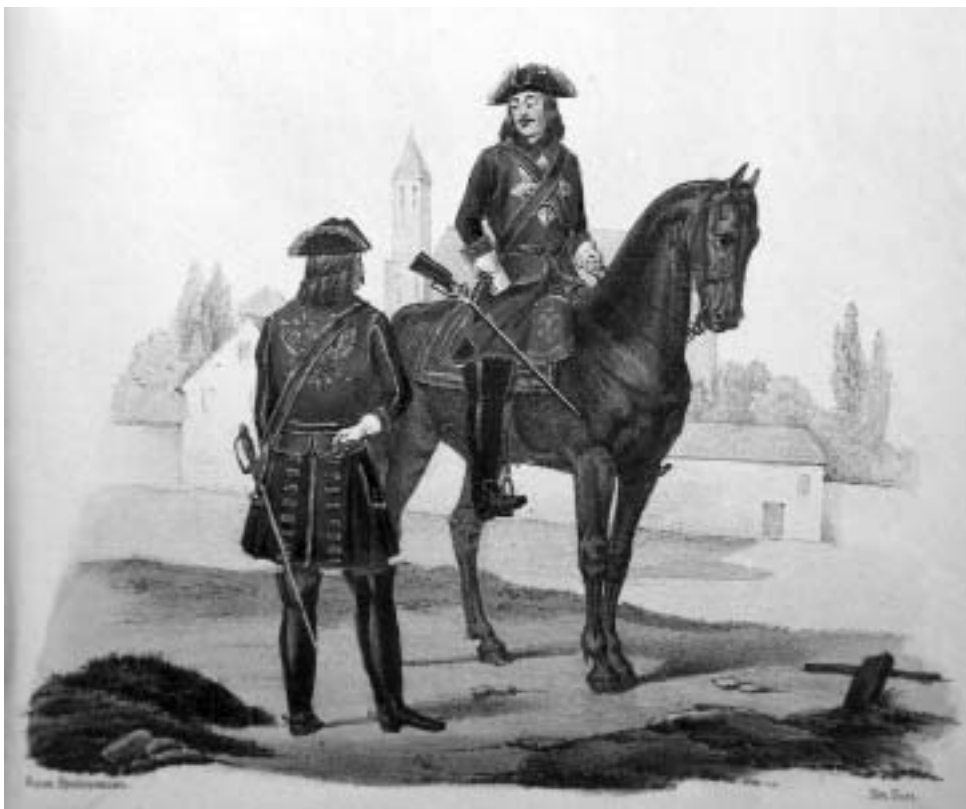
Кавалергарды. Офицер и рядовой. XVII-XVIII вв.

обмундирования высказывался следующим образом: «Пудра – не порох, булки – не пушки, коса – не тесак, а я не немец, а природный русак». За что и оказался «на выселках» в деревне.