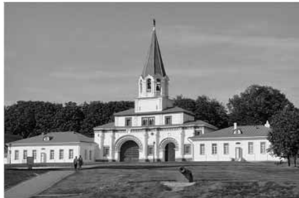
Москва. Коломенское. Передние ворота с колокольней.

Здесь – места раздольные, древние, привольные, Здесь – село Коломенское и Москва-река, Храмы богомольные, звоны колокольные, Связанные накрепко с Русью на века.