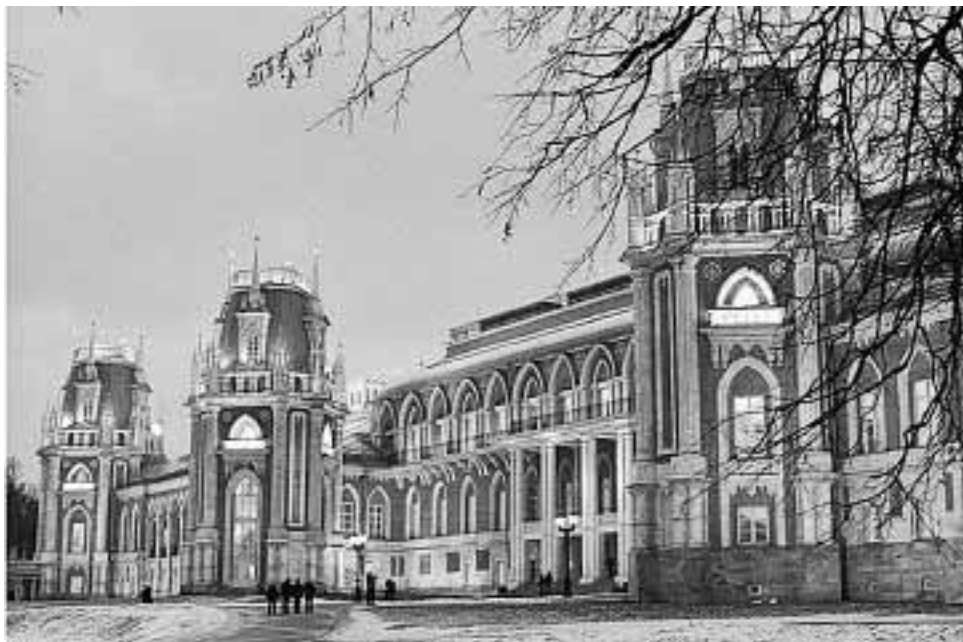
Москва. Царицыно. Большой Дворец.

Поведать старинные были О многих свершеньях людей, Которые здесь творили На благо России своей.