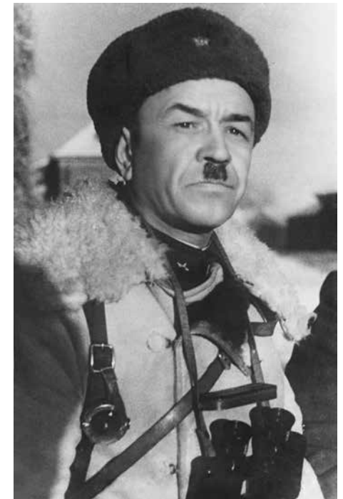
Иван Васильевич Панфилов

Поэтому главный вопрос, стоящий перед бывшим командиром батальона, а теперь командиром батальона Боуржаном Момыш-Улы – «как