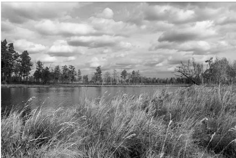
Озеро возле кордона Двадцатиха

крупная сова – длиннохвостая неясить может генерировать подобные звуки. Видимо, совы общались со своими слётками. Впрочем, стояла тьма, и надеяться разглядеть ночных говорунов было нереально. Но сов можно было поблагодарить за побудку. Неподалёку гремела гроза, и нужно было накрыть ветхое жилище полиэтиленом. К утру и впрямь стало накрапывать. Но дождик был недолгим. К обеду я уже добрался до посёлка Норск, откуда вскоре попал на кордон заповедника «Двадцатиха».