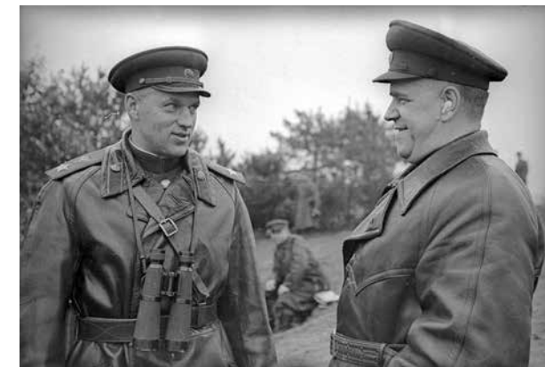
К.К. Рокоссовский и Г.К. Жуков