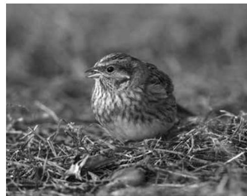
Доверчивый самец белошапочной овсянки

После 20 сентября полетели северные гуси. В это время по всему Приамурью движутся в поднебесье клинья белолобых гусей, гуменников, редких пискулек, иногда в них встраиваются лебеди – кликуны.