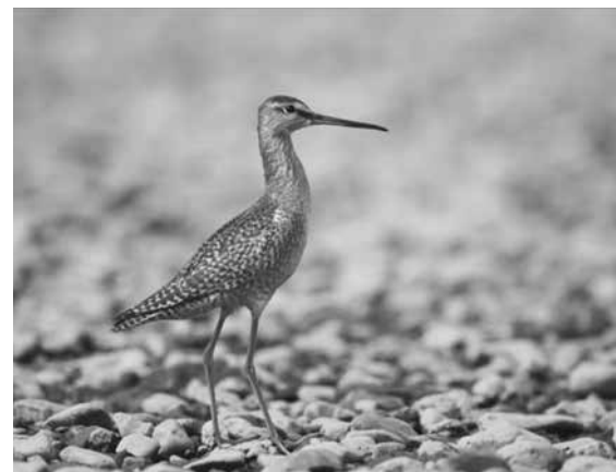
Щёголь – новый пролётный вид Норского заповедника

в осеннем перье. Поражала доверчивость птицы. Обычно так ведут себя северяне, которые никогда не видели людей, и воспринимают их кем-то вроде северных оленей или медведей.