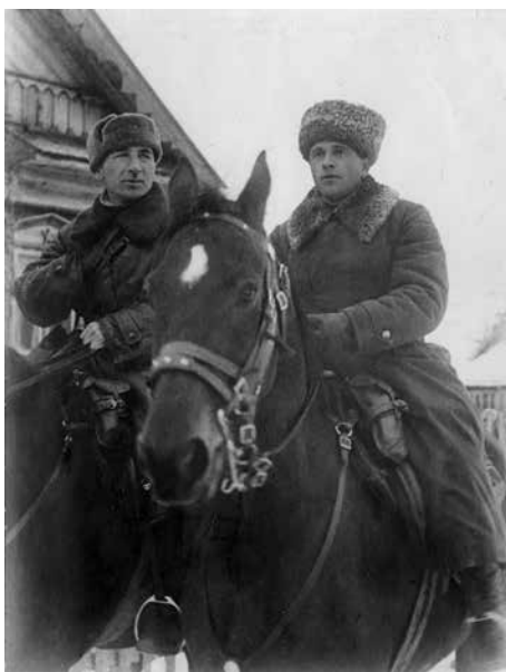
Л.М. Доватор и И.А. Плиев

Даже в самые тяжёлые дни, вспоминал Рокоссовский, Лев Михайлович не терял присутствия духа. «Тов. Доватор! На Вас смотрит вся Европа. Есть возможность отличиться. Надеюсь на то, что Вы решительным быстрым контрударом с танками на Пешки восстановите положение». На этой записке, полученной от Рокоссовского 25 ноября,